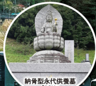
納骨型永代供養墓 「祈り」