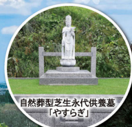
自然葬型芝生永代供養墓 「やすらぎ」

千二百有余年の伝統と歴史をもつ高松山観音寺で 四季移ろう自然に抱かれ、安らかな時間をお過ごしください。