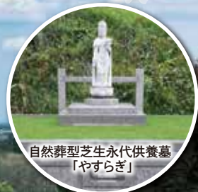
自然葬型芝生永代供養墓 「やすらぎ」

千二百有余年の伝統と歴史をもつ高松山観音寺で 四季移ろう自然に抱かれ、安らかな時間をお過ごしください。