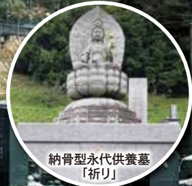
納骨型永代供養墓 「祈り」