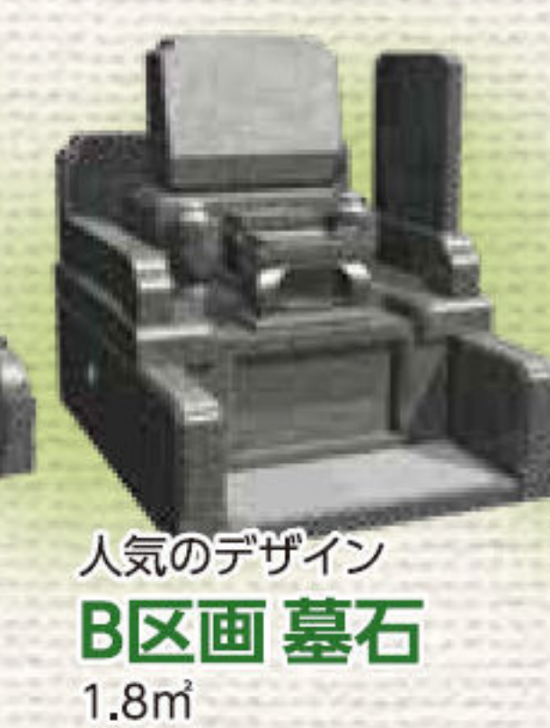
人気のデザイン B区画 墓石 1.8㎡