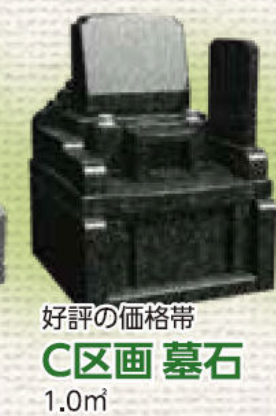
好評の価格帯 C区画 墓石 1.0㎡