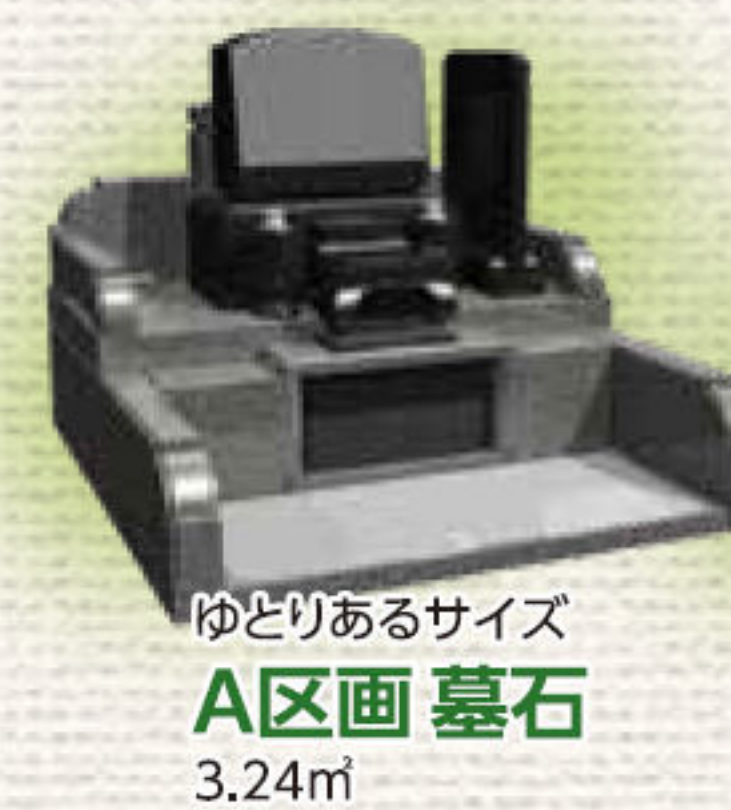
ゆとりあるサイズ A区画 墓石 3.24㎡