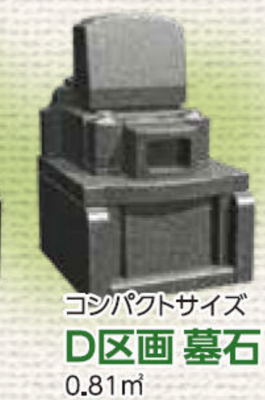
コンパクトサイズ D区画 墓石 0.81㎡